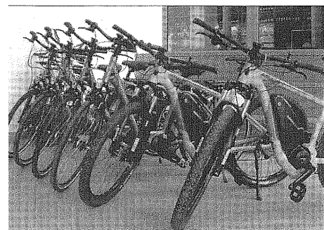
-Bikes stehen an 14 Stationen im Taunus.