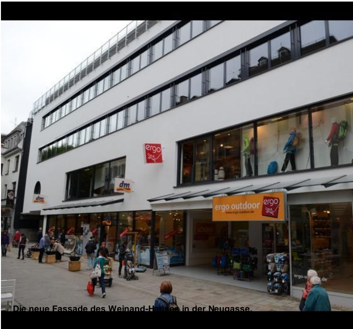
Die neue Fassade des Weinand-Hauses in der Neugasse.

WIESBADEN - (mag). Nach dem Auszug der Stadtbücherei aus dem Weinand-Haus und nach dem abgeschlossenen ersten Bauabschnitt hat die Neugasse ein neues Gesicht